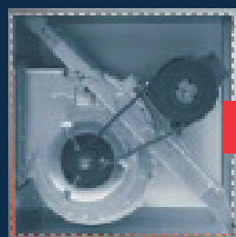
Ineffizienter riemengetriebener Ventilator